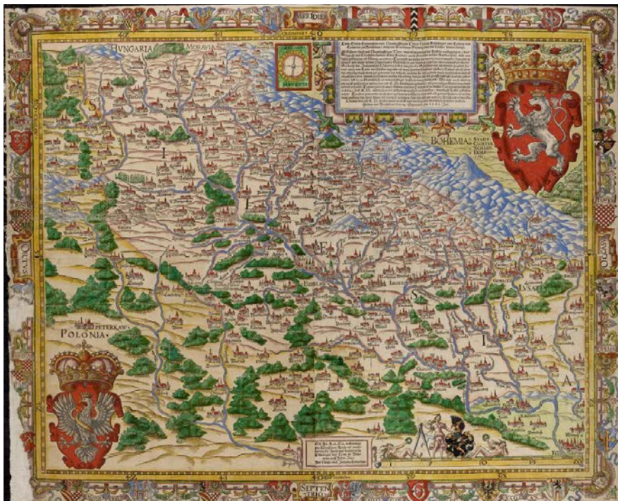
Ryc. 1. Pierwsze wydanie mapy Śląska Martina Helwiga, Neisse [Nysa] 1561 (zmniejszenie), Badische Landesbibliothek, Karlsruhe, sygn. Gg 1

prezentowanym śląskim zabytkiem kartograficznym na wielu wystawach, głównie w Polsce i w Niemczech.