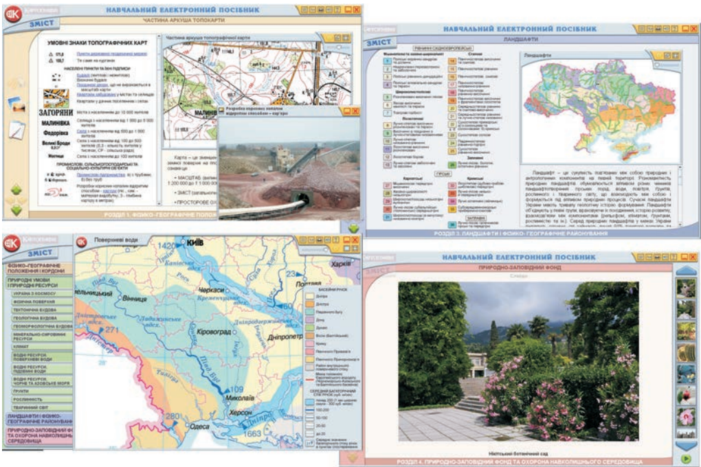
Рис. 4. Інтерфейс і зміст електроничної картографічної допомоги дидактичної „Географія фізична України”

o świecie, o wzajemnych relacjach przyrody, człowieka, gospodarki, uczą przestrzennego myślenia, a przede wszystkim dają uczniom możliwość stania się współczesnymi, rozwijającymi się, umiejącymi posługiwać się komputerami ludźmi.