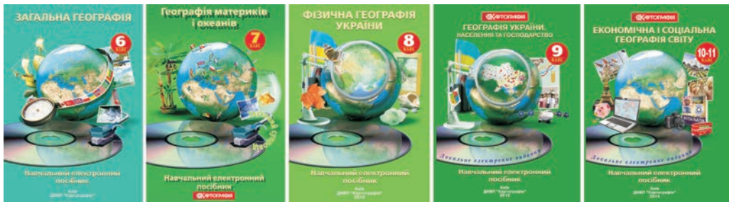
Ryc. 2. Okładki elektronicznych pomocy szkolnych z geografii opracowanych przez DNWP „Kartografia”

Elektroniczne kartograficzne pomoce dydaktyczne zawierają interesujący materiał geograficzny, który jest funkcjonalny, ma dydaktyczną wagę, metodyczną wartość, dopełnia i rozsze-