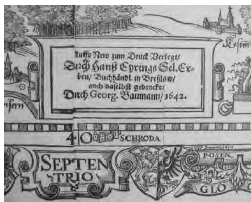
Ryc. 2. Nota wydawnicza piątego wydania mapy Śląska Martina Helwiga