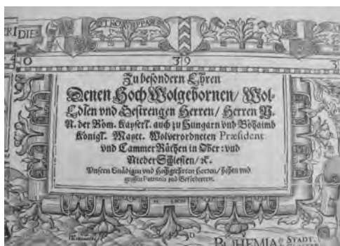
Ryc. 3. Kartusz z tekstem dedykacji na piątym wydaniu mapy Śląska Martina Helwiga

Na zakończenie warto poinformować, że do liczby znanych egzemplarzy mapy Śląska Martina Helwiga z 1561 roku można dodać kolejny egzemplarz pierwszego wydania z 1776 roku. Egzemplarz takiego wy-