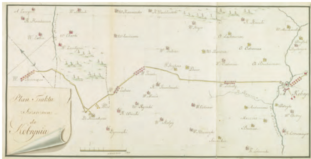
Ryc. 6. Plan traktu z Szczerczewa do Kobrynia, ok. 1:100 000, 37×18,2 cm, w: Atlas podróży króla Stanisława Augusta Poniatowskiego z Lada do Horodca , 1784 r., Michał Połchowski, rękopis wielobarwny, 12 kart (w tym 10 map różnej skali) oprawnych w skórę, 15×19 cm, k. 8

po 1795 r. pozostały w Warszawie, uległy rozproszeniu 50 . Po drugiej wojnie światowej część map pochodzących ze Zbioru Geograficznego Stanisława Augusta zgromadzono w AGAD,