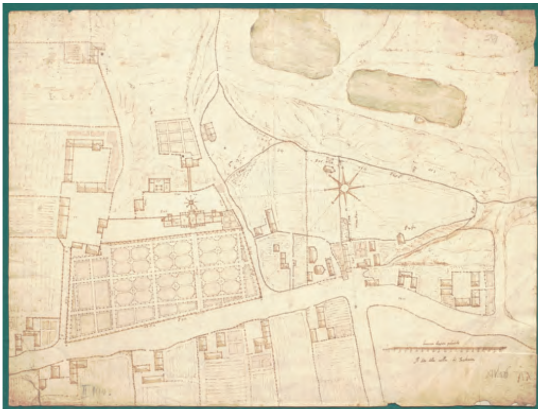
Ryc. 1. Plan sytuacyjny dworu i ogrodu w Ujazdowie, 1606 r., Alessandro Albertini, ok. 1:800, rękopis wielobarwny, 56×42 cm, AGAD, Zb. Kart. 570-1

koskalowe mapy gruntowe, 4) mapy leśne, 5) mapy wojskowe, 6) mapy hydrograficzne, 7) mapy komunikacyjne, 8) wielkoskalowe mapy