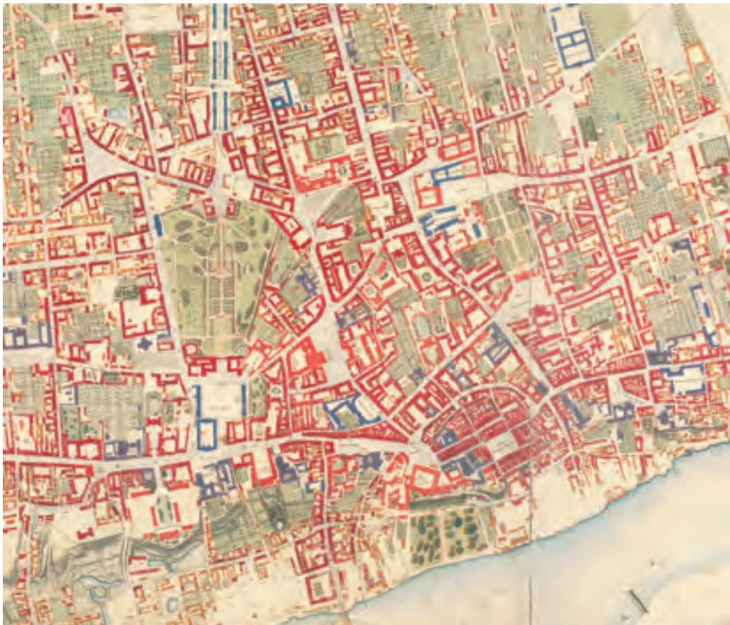
Ryc. 3. Plan sytuacyjno-regulacyjny Warszawy, 1837 r., Józef Koriot, Karol Richter, Pipenberg, Grotenfeld, Schroeders, 1:4200, litografia kolorowana, ark. 5: 65,8×52,5 cm, ark. 6: 64,5×52 cm (fragmenty)

w tym kilkadziesiąt planów ogólnych, obejmujących terytorium miasta w jego granicach administracyjnych oraz prawie tysiąc planów części miasta, terytoriów przedmiejskich, dzielnic, ulic,