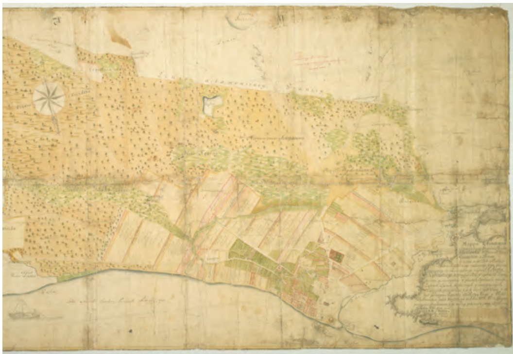
Ryc. 7. Plan miasta i gruntów Włocławka, 1787 r., Marcin Sitz, ok. 1:6000, rękopis wielobarwny 124,5×67 cm Fig. 7. Map of the city and land of Włocławek, 1787, by Marcin Sitz, approx. 1:6000, multicolor hand drawing

unikatowe, wielobarwne i rękopiśmienne dzieła kartograficzne. Niektóre z nich należą do rzadko spotykanych w zbiorach polskich map grun-