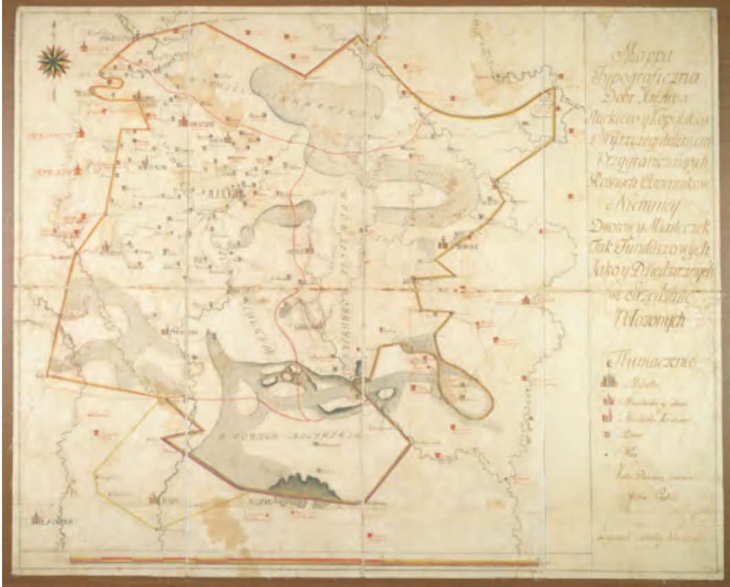
Ryc. 2. Mapa księstwa słuckiego i kopylskiego, koniec XVIII w., Mikołaj Kleczowski, ok. 1:200 000, rękopis wielobarwny, 80,5×65 cm

więtnastowiecznych map ziem polskich należy zaliczyć Topograficzną kartę Królestwa Polskiego w skali 1:126 000, sporządzoną częściowo w latach 1822–1830 przez Kwatermistrzostwo