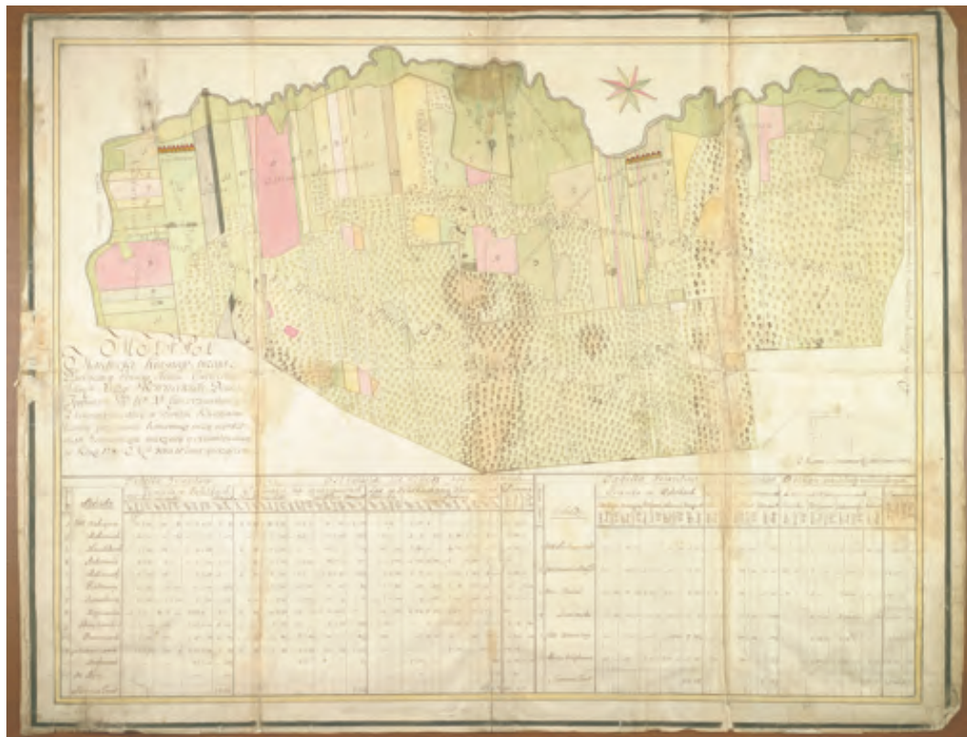
Ryc. 5. Mapa majątności Kirsana, 1768 r., Piotr Kamiński, Mateusz Łukaszewicz, Jan Konstantynowicz, ok. 1:11 200, rękopis wielobarwny, 79,5×61 cm

tymi sądami mapy stanowiły materiał dowodowy lub były wykonywane jako swojego rodzaju ilustracja wyroku. Zespół składa się z map gruntowych sporów granicznych dotyczących dóbr