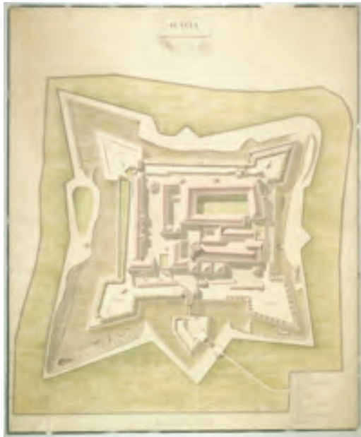
Ryc. 4. Plan fortecy jasnogórskiej, ok. 1785 r., Jakub de Seigny, 1:400, rękopis wielobarwny, 92,5×112 cm

Pozostałe zespoły map, czy raczej szczątki zespołów są znacznie mniejsze liczebnie, ale